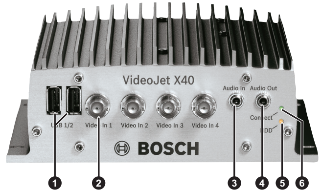
Encodeur VideoJet X40 – Avant